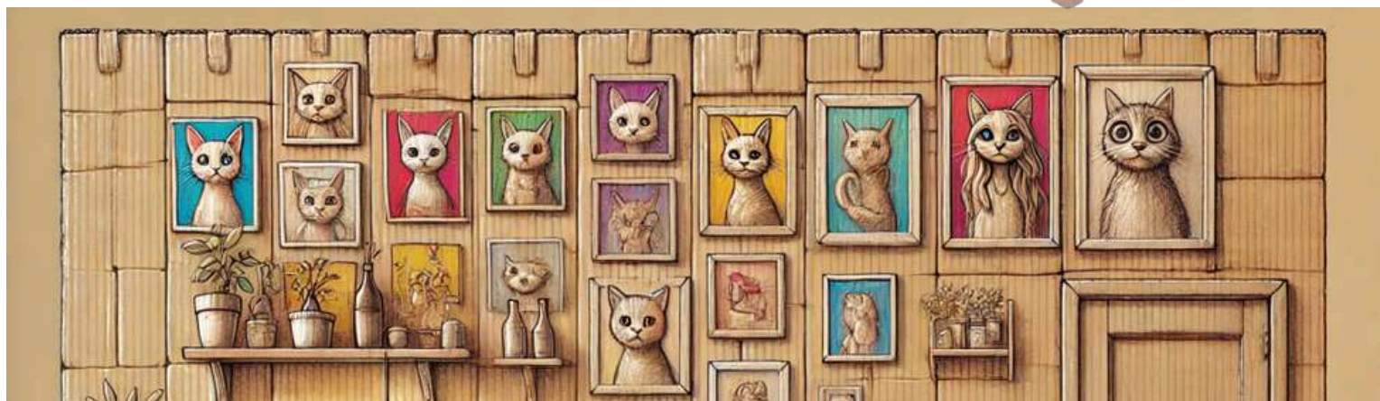
RECHERCHES ICONOGRAPHIQUES Marine Arcicault 2024 à partir d'une intelligence artificielle

Les cadres photos kitsch : ils donnent vie aux animaux, centraux dans l'intrigue, et renforcent le côté humain et sensible de nos deux personnages, les rendant encore plus attachants.