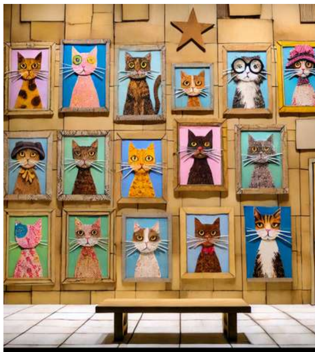
RECHERCHES ICONOGRAPHIQUES Mairine Arcécault 2024 à partir d'une intelligence artificielle

Esthétique : Une scénographie stylisée comme dans un environnement en 2D, inspirée des cartoons. Chaque élément est là pour servir le jeu burlesque. L'aspect carton du décor vient appuyer le côté ludique. Le carton peut être un très bel imposteur, et se faire passer pour ce qu'il n'est pas, matériau façonnable, léger, écologique, destructible... et BRUN ! Il permet de moduler l'espace scénique... Si bien qu'on ne sait plus qui des comédiens ou de la scénographie manipule qui !