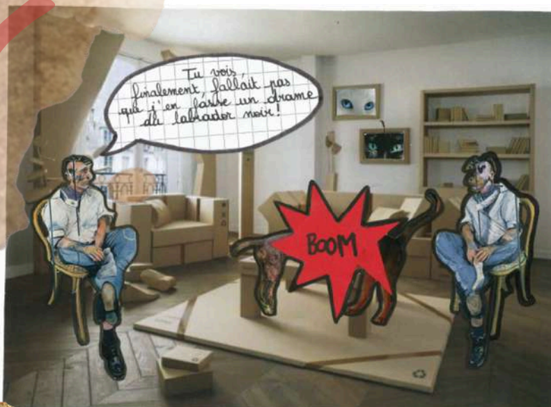
RECHERCHES ICONOGRAPHIQUES Marine Artaud 2023 Routines et contemplation (Collages à partir d'E. HOPPER)

Les personnages sont maniérés et ont des habitudes de mouvements. Comme deux clowns burlesques ils ont une mécanique du geste, du geste vital.